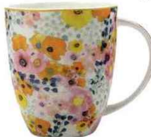
Mug Cashmere Bloems de Maxwell & Williams. Prix public : environ 8,80 € • Cashmere Bloems mug by Maxwell & Williams. Price to the public: around €8.80