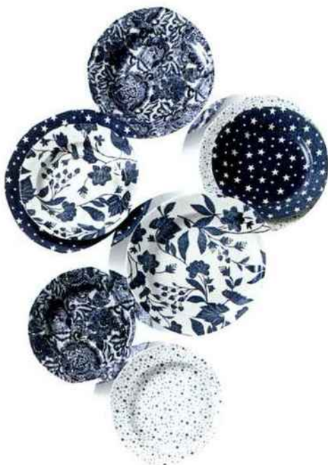
Collection Ralph Lauren & Burleigh présentée dans le restaurant Ralph's à Paris avec des décors de pivoines et de plantes grimpantes • Ralph Lauren & Burleigh collection presented at Ralph's restaurant in Paris with peony and climbing plant decorations