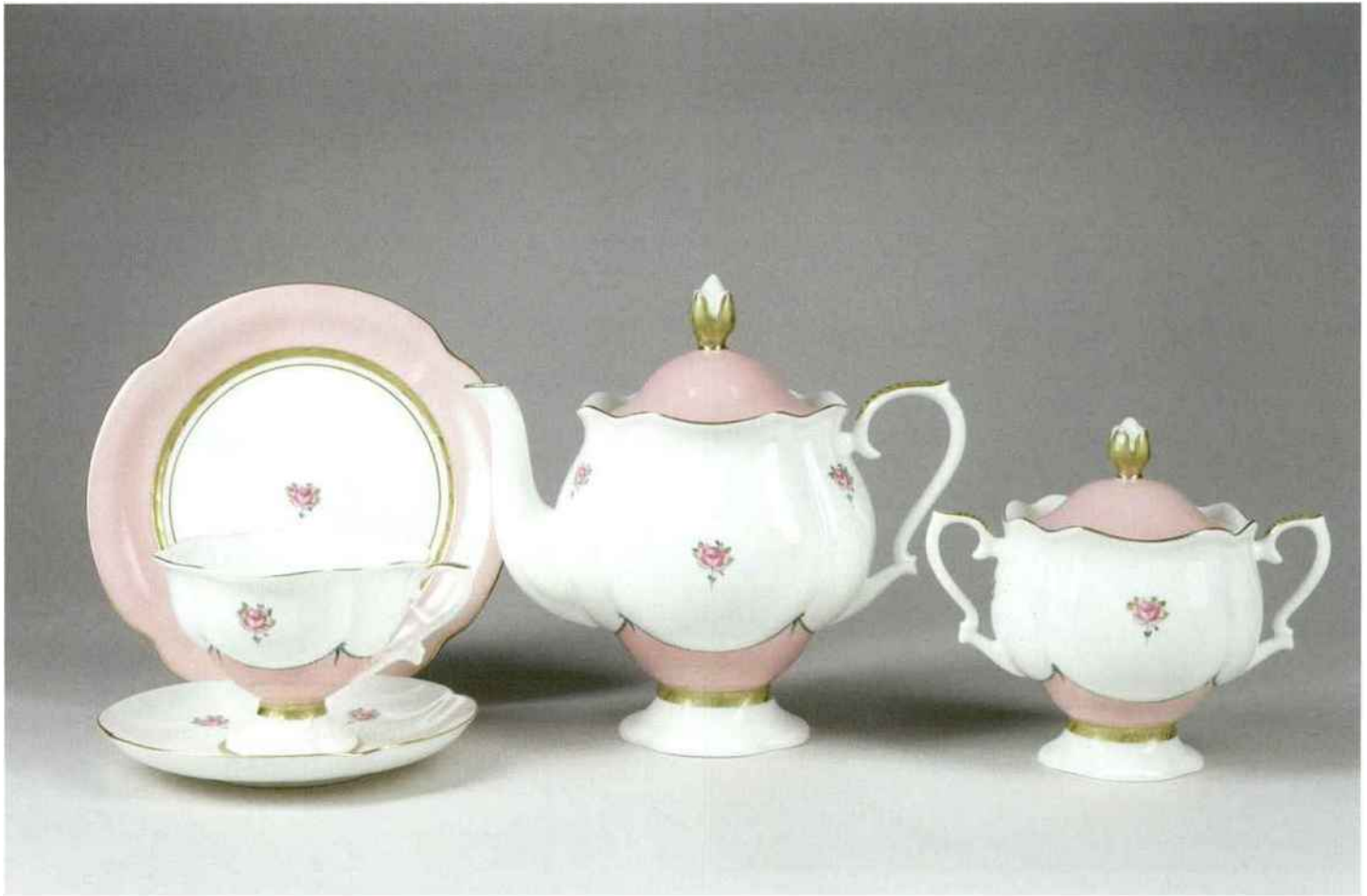
Romance d'Imperial Porcelain, de forme Katarina, décoré à la main, par la styliste Ulyana Sergeenko • Romance by Imperial Porcelain, Katarina form, hand-decorated by the fashion designer Ulyana Sergeenko

du XIX e siècle par le drapier anglais Arthur Lasenby Liberty. Un motif qui inspire notamment la marque anglaise Katie Alice qui utilise des motifs fleuris vintage pour sa collection English Garden. Le style liberty inspire aussi la marque anglaise Maxwell & Williams qui, avec Cashmere Bloems, associe de multiples couleurs se fondant les unes aux autres sur des mugs ou un service à thé.