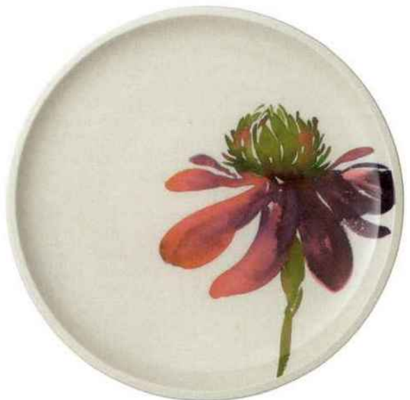
Collection Artesano flower art de Villeroy & Boch. Prix public : 19,90 € l'assiette plate • Artesano flower art collection by Villeroy & Boch. Price to the public: €19.90 for the flat dish

During the 15 th century, printing and the appearance of paper for preparing herbariums meant that botanics developed as a scientific discipline in its own right, alongside the growth of botanical gardens and science-related expeditions. Villeroy & Boch invites us to share this magic via a number of collections such as Artesano Flower Art, made of premium porcelain.