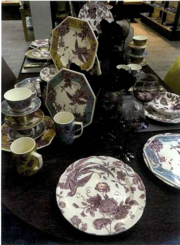
Collection Kingsley de Spode (groupe Portmeirion). Prix public : 114 € le set de 4 tasses + soucoupes • Kingsley collection by Spode (Portmeirion group). Price to the public: €114 for the set of 4 cups + saucers