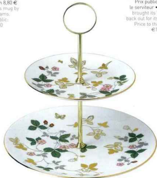
Wedgwood réédite Wild Strawberry pour ses 260 ans. Prix public : environ 150 € le serviteur • Wedgwood has brought its Wild Strawberry back out for its 260th birthday. Price to the public: around €150 for the stand