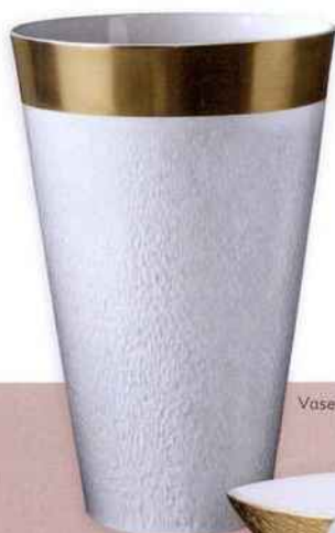
Vase, Mineral Filet Or

Raynaud joue avec les codes de son époque en invitant chacun à s'amuser avec les multiples contenants de cette collection qui offrent à dresser des tables originales aussi distinguées qu'épatantes. Le service existe – avec un filet or ou platine – dans une palette de dix teintes irisées aux accents de terre ocrée, de végétaux ou de minéraux, ainsi qu'en or jaune précieux. La lumière joue avec la matière et les reflets de l'émail, les pigments irisés créent ce fond mat qui confère aux pièces un air si moderne.