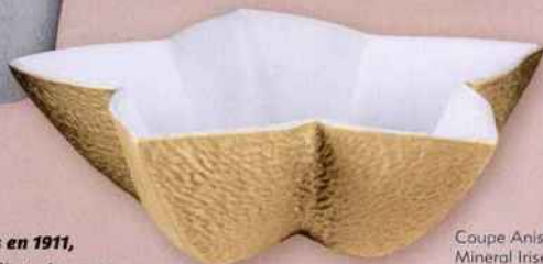
Coupe Anis Mineral Irise