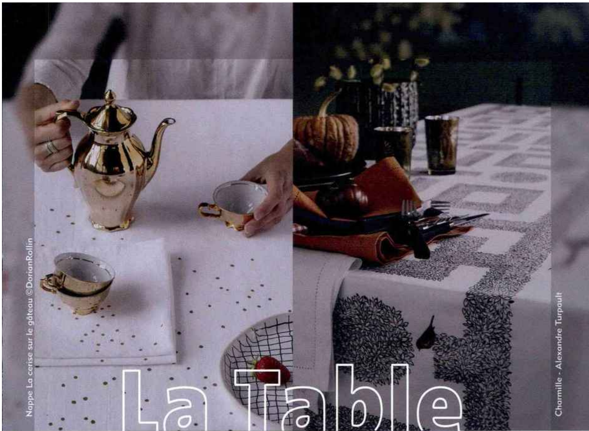
Nappe La cerise sur le gâteau