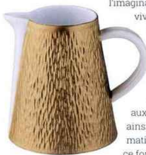
Crémier, Mineral Irise