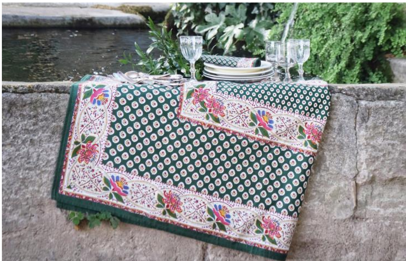
Gloire à la Provence ! Souleïado > Souleïado. Site Internet .