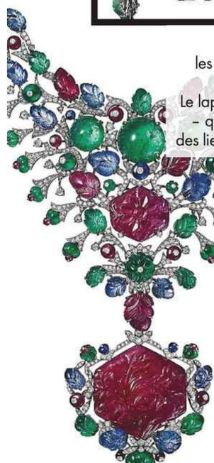
BOUQUET CHROMATIQUE Collier "Udyana" en platine avec rubis, émeraudes, saphirs et diamants, collection Haute Joaillerie Sixième Sens, Cartier.

"Cartier et les arts de l'Islam. Aux sources de la modernité", jusqu'au 20 février, au musée des Arts décoratifs de Paris.