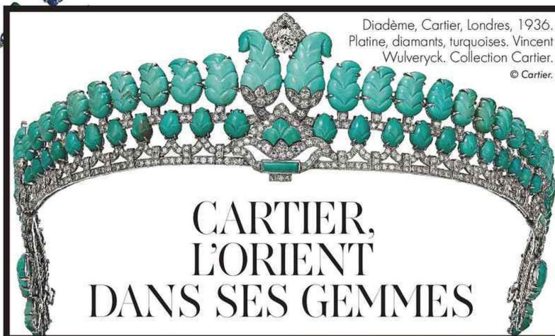
Diadème, Cartier, Londres, 1936. Platine, diamants, turquoises. Collection Cartier.

LIANES ET VOLUTES Assiette plate "Salamanque Or" en porcelaine, Raynaud .