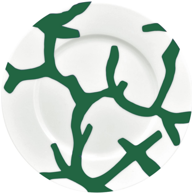
Assiette plate à aile n°2 ø22 cm

C'est une nouvelle version que la maison Raynaud dévoile en ce second semestre 2022, avec une profonde couleur vert émeraude. Celle-ci complète la collection rouge corail originale et la version bleu outremer et plonge la table dans les mystères et la beauté des abysses et des fosses marines.