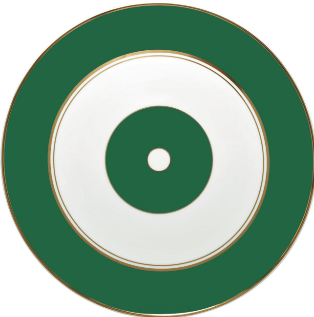
Plat à tarte 31 cm

C'est une nouvelle version que la maison Raynaud dévoile en ce second semestre 2022, avec une profonde couleur vert émeraude. Celle-ci complète la collection rouge corail originale et la version bleu outremer et plonge la table dans les mystères et la beauté des abysses et des fosses marines.